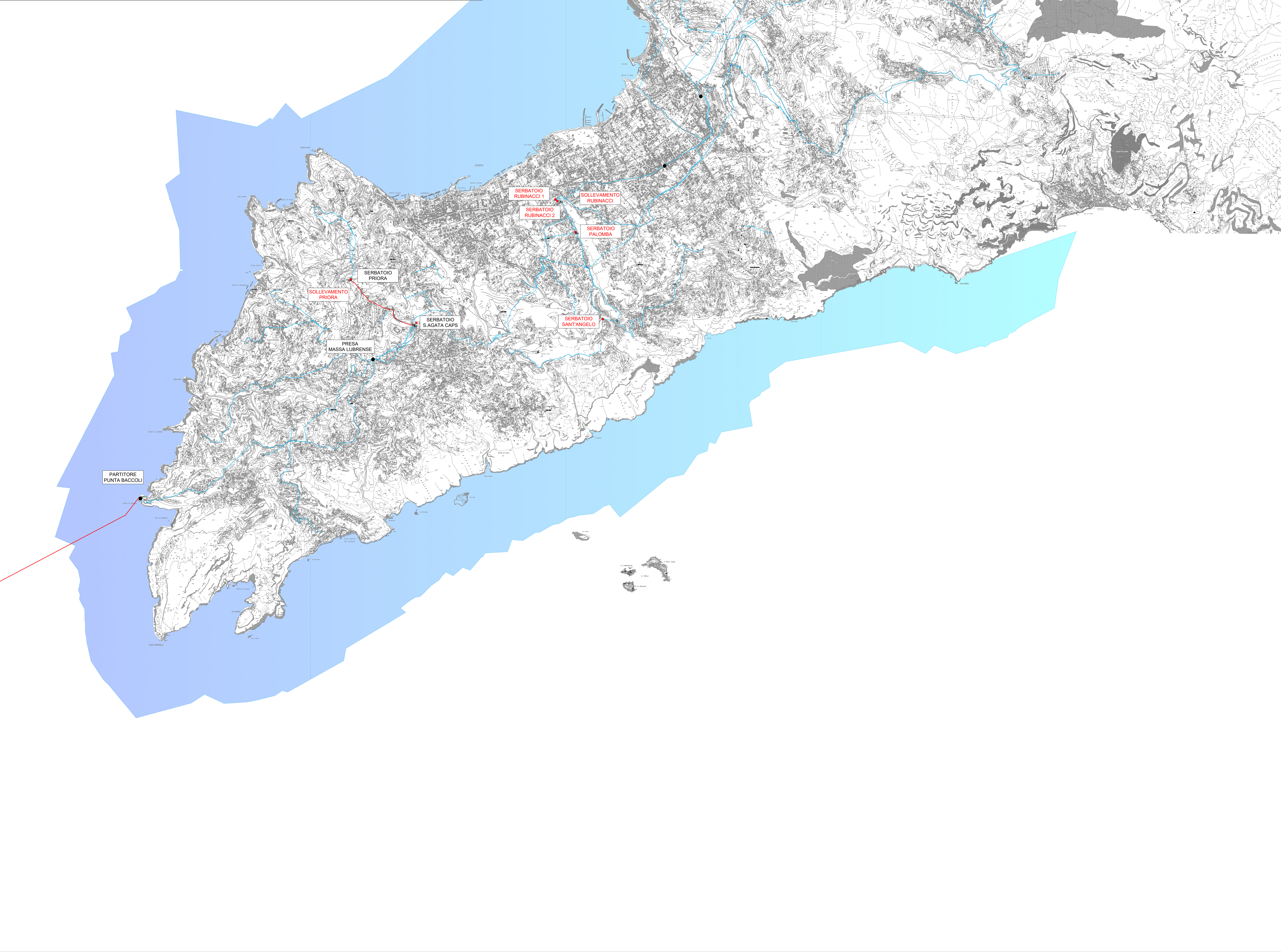
Planimetria scale 1:20'000